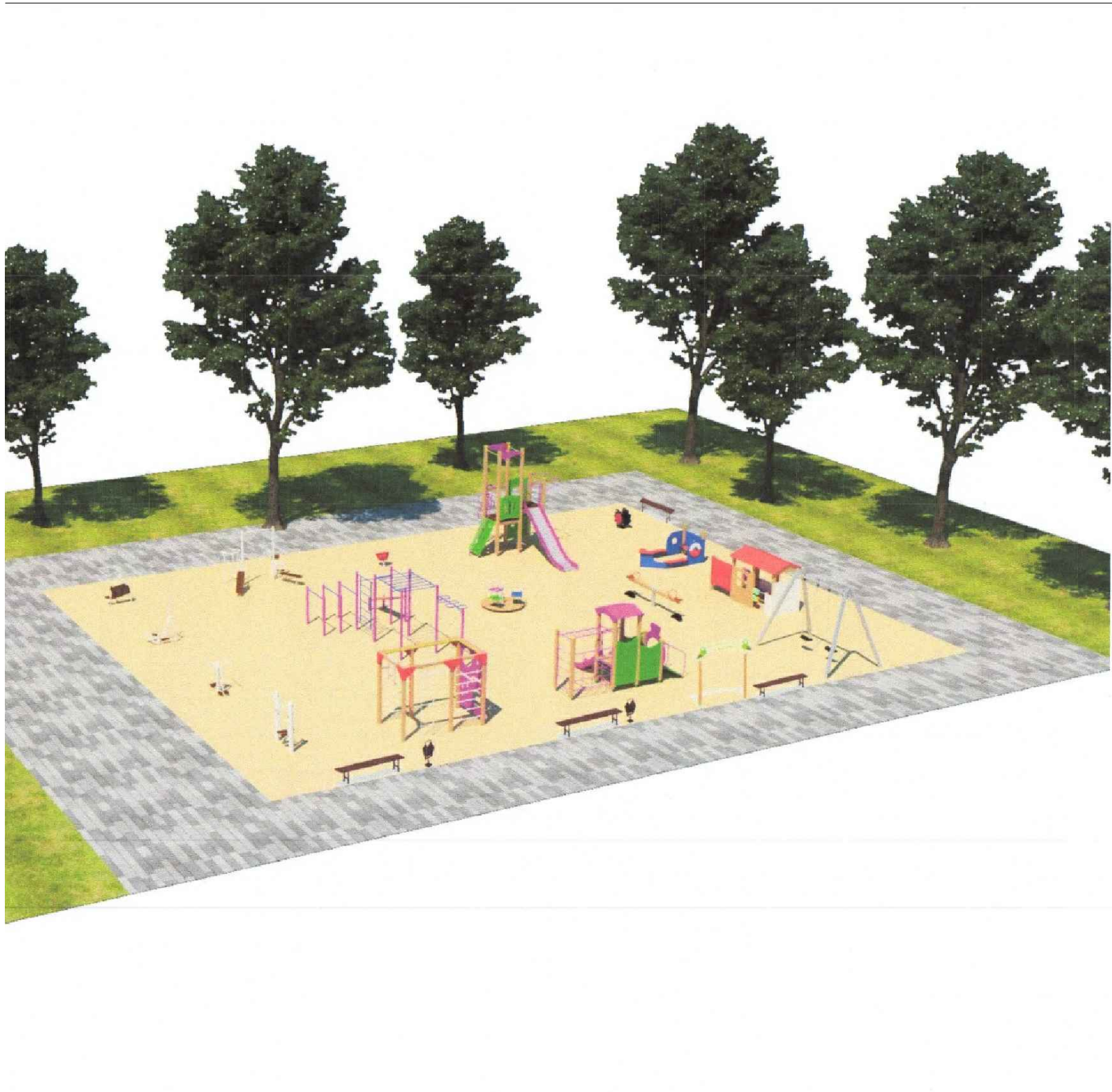
Тип 1 (проектируемое плиточное покрытие)